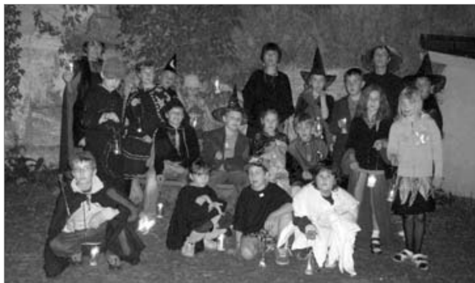
Z čarodějné noci v knihovně, konané 10. června 2011.

Měsíčník Náchodský zpravodaj. Vydává Město Náchod, IČO: 00272868, Masarykovo náměstí 40, 547 61 Náchod.