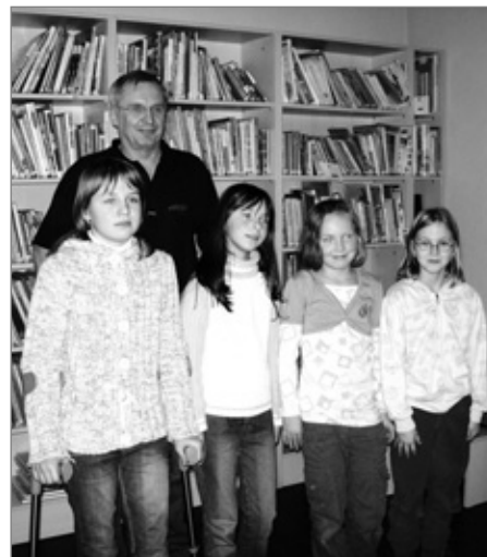
Na fotografii spisovatel a básník Miloš Kratochvíl s vítězi literární soutěže Jakou barvu má svět .