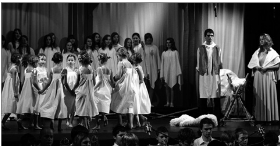
Fotografie z vánočního koncertu žáků ZUŠ J. Falty v Náchodě 15. 12. 2009.