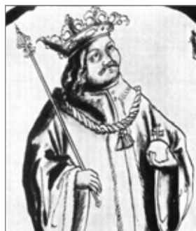
Jiří z Poděbrad