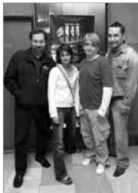
Protagonisté filmu Prachy dělají člověka při premiéře v náchodském kině Vesmír.

Ve svazku jsou i zprávy o literatuře a zprávy z archivu, je tu také dokončena výběrová bibliografie článků z Nového a posléze Našeho času od roku 1981 do konce jeho existence začátkem roku 2002. Myslím, že tu mělo být odděleno období totalitní, kdy vycházel jako orgán KSČ, od období dalšího, kdy byl periodikem nezávislým. To se totiž výrazně změnil jak obsah článků, tak i okruh autorů. (AF)