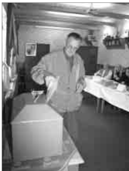
Výsledky voleb do Zastupitelstva města Náchoda str. 10–11.