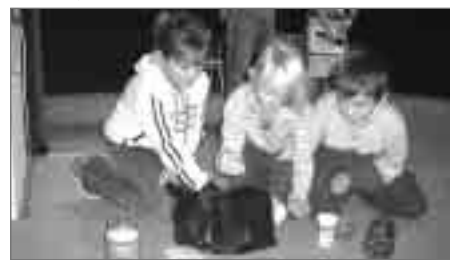
Vítězná trojice superfinále ve třídění odpadů