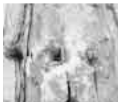
c) plodnice poprašky

(Zdroj: Parazitické dřevokazné houby, A. Černý)