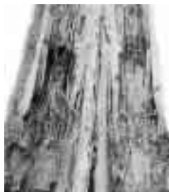
b) podélný řez napadeného kmene