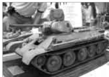
T 34/76 model 1942 autor Giovanni Chagia z Itálie (Genova) získal cenu MK Náchod