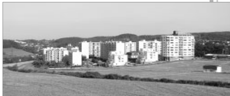
Sídliště SUN v roce 2004

tových jednotek, a už tehdy se ukázaly problémy s dalším financováním a s rozestavěným obchodním střediskem a domem služeb. Problémy v obou směrech přetrvávají dodnes a jsou právě nyní, kdy se zavírá prodejna Meisl a vážne realizace projektu firmy Isramco, obzvlášť žhavé, ale to je jiné téma. Vraťme se do roku 1991, kdy byla provedena kolaudace prvních obytných objektů a začali se do nich stěhovat první nájemníci, a bylo také třeba pojmenovat nově vzniklé ulice. Tehdy příslušná komise navrhla, aby všechna jména ulic v novém sídlišti byla odvozena od barev. A tak první dvě ulice zkolaudovaných domů byly nazvány Růžová a Zelená . Jména měla být tzv. mluvící a podle představ komise měla být Zelená ulice skutečně plná zeleně a v Růžové měly kvést růžo-