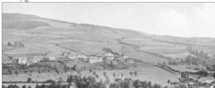
Úbočí Dobrošova dosud téměř bez zástavby (pohled ze zámeckého kopce)

Babí, které bylo do jara 1950 samostatnou obcí a poté se stalo součástí „velkého“ Náchoda, dlouho necítilo potřebu své ulice pojmenovávat. Ale jak se rozrůstalo a vlastně se stalo předměstskou čtvrtí Náchoda, byly zde ulice pojmenovány na přelomu 60. a 70. let 20. století. A právě zde najdeme ty voňavé a chutné, pojmenované